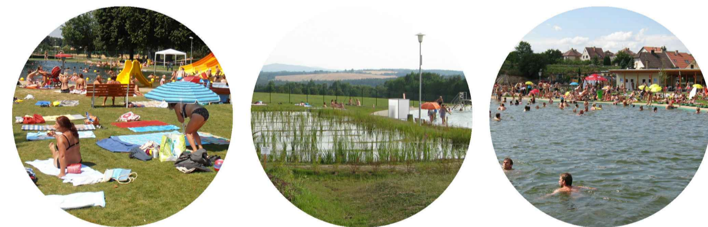
POBYTOVÁ PLOCHA BIOLOGICKÉ LAGUNY PLAVECKÉ ČÁSTI

POZNÁMKA: • po provedení opatření k ochraně hydroizolace je možné biotop využívat v zimním období pro bruslení