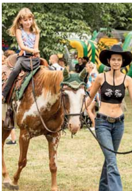
Countryfest viac na str. 20 - 21