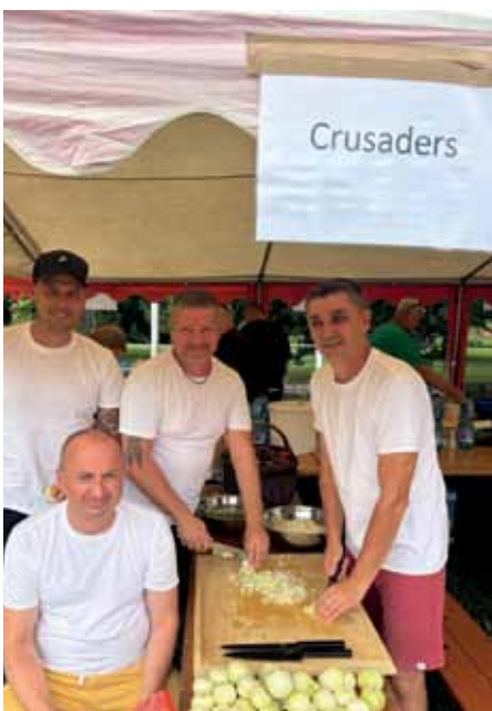
Gulášová pohoda viac na str. 12 - 13