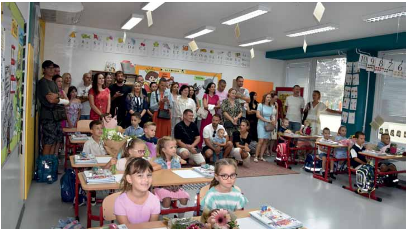
Slávnostné otvorenie školského roka 2024/2025 viac na str. 24 - 25