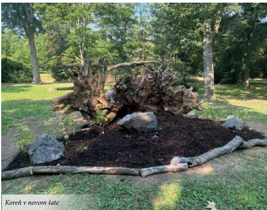
Koreň v novom šate