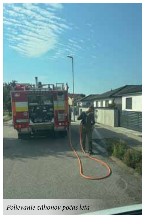
Polievanie záhonov počas leta