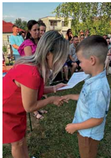
Rozlúčka s predškolákmi viac na str. 27