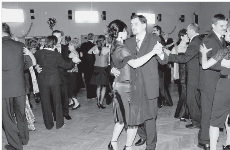
● Richtársky ples je regionálnym kultúrnym podujatím. Útulné prostredie spoločenského domu, kvalitná kuchyňa a dobrá obsluha má povest' široko ďaleko. O vstupenky na tento reprezentačný ples je každoročne veľký záujem.