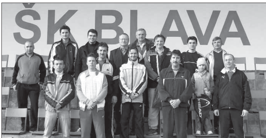
● Účastníci domácej tenisovej premiéry.