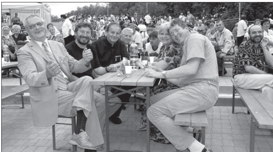
● Kajzer a Meluš prídu 1. júla do Jaslovských Bohunic opäť...

16. september DYCH FEST - festival dychových súborov (amfiteáter)