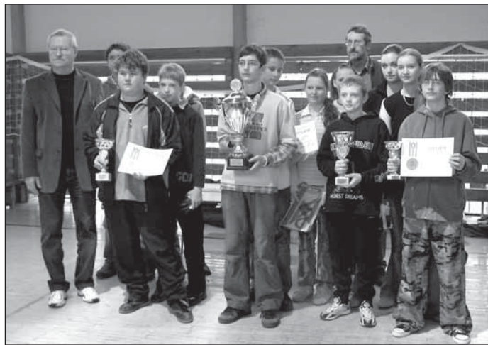
● Spoločná fotografia na záver súťaže.