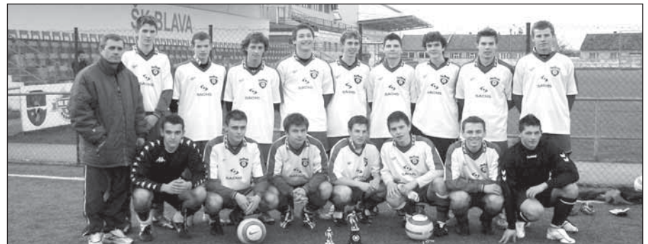
● Víťazi turnaja – chlapci Spartaka Trnava B si odniesli putovný pohár.

Usporiadatelia i hráči nasadili dobrú športovú a organizačnú úroveň. Víťazom blahoželáme a veríme, že o rok si mužstvá opäť zmerajú svoje sily o putovný trofej. REDAKCIA