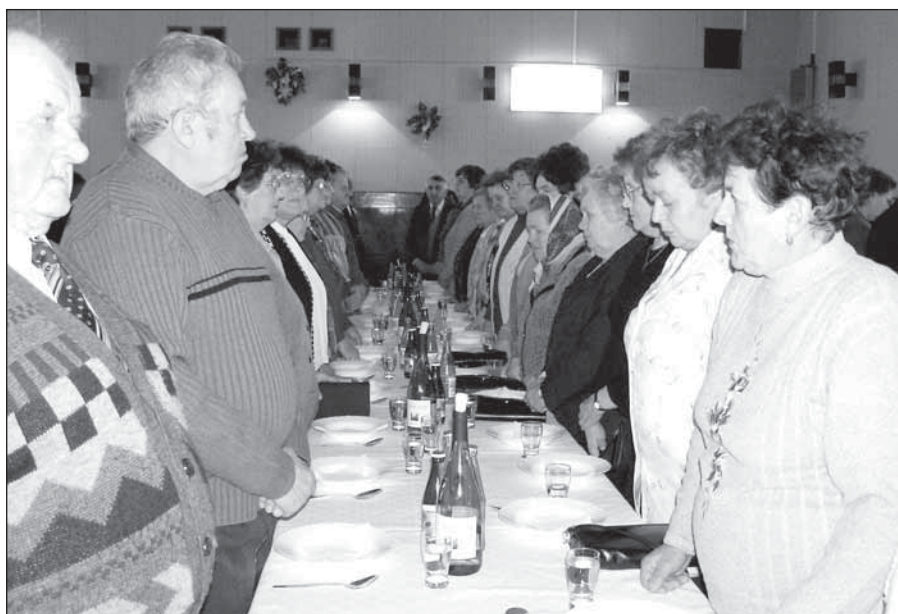
● Zosnulých členov si dôchodcovia uctili minútou ticha.

ký. Najviac to postihlo dôchodky Slovenska. Ešte veľa vody pretečie našou Blavou, aby sme sa priblížili dôchodkami a životom ľuďom v Európskej únii.