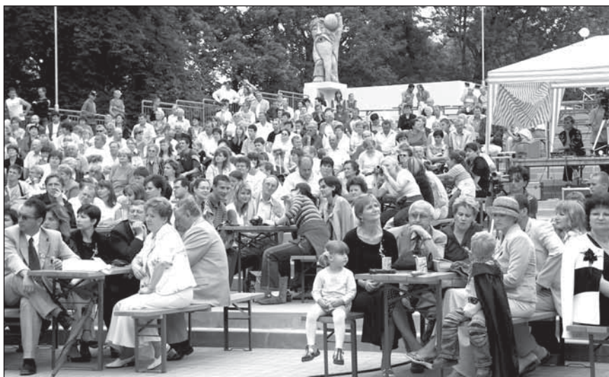
● Spomínate, ako sme vlani v lete amfiteáter otvárali?