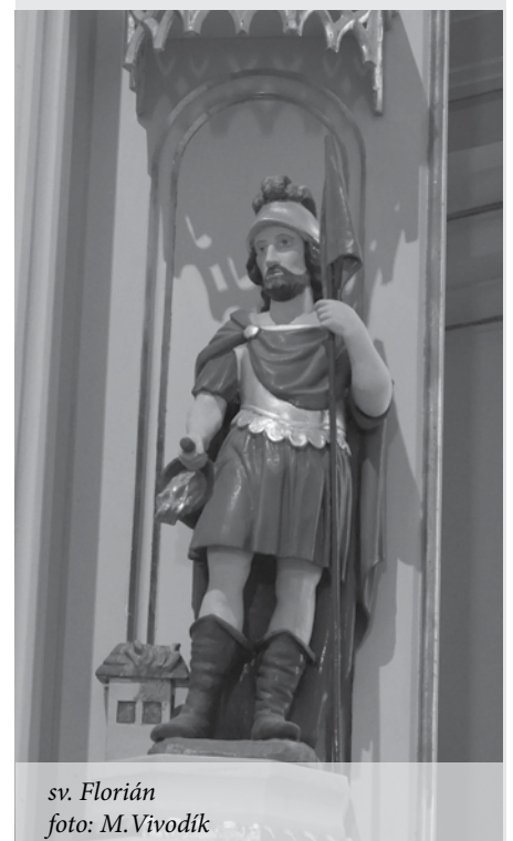
sv. Florián

Spracované podľa www.zivotopisysvatych.sk