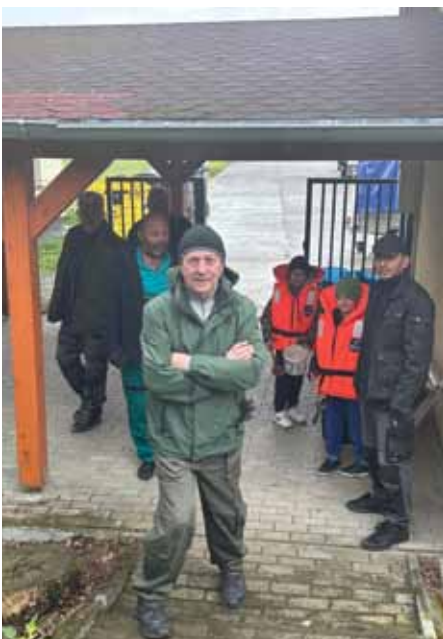
Deň zeme viac na str. 16 - 17