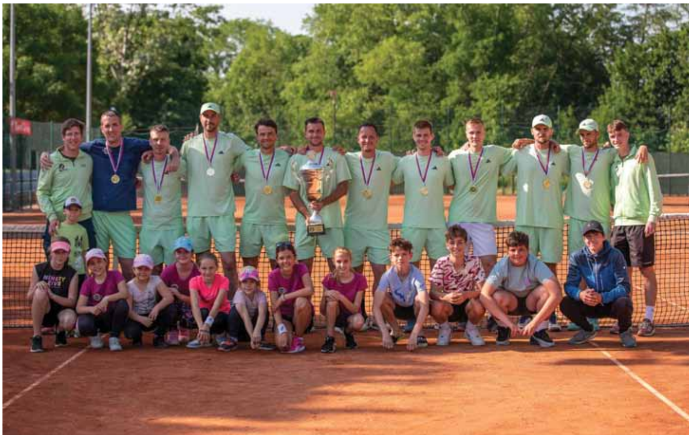
Na fotke - družstvo mužov a detí TK ŠK Blava 1928 Jaslovské Bohunice