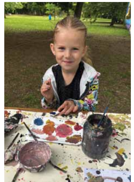
Deň detí sme oslávili vo veľkom štýle viac na str. 22-23