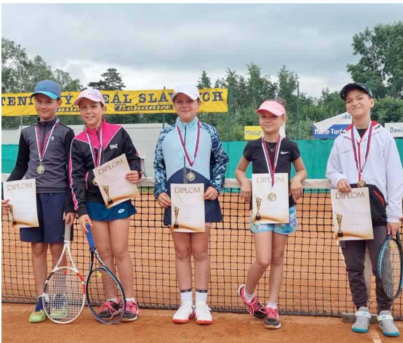
Na fotke zmiešané družstvo detí do 10 rokov TK ŠK Blava 1928 Jaslovské Bohunice, foto: Marián Varga