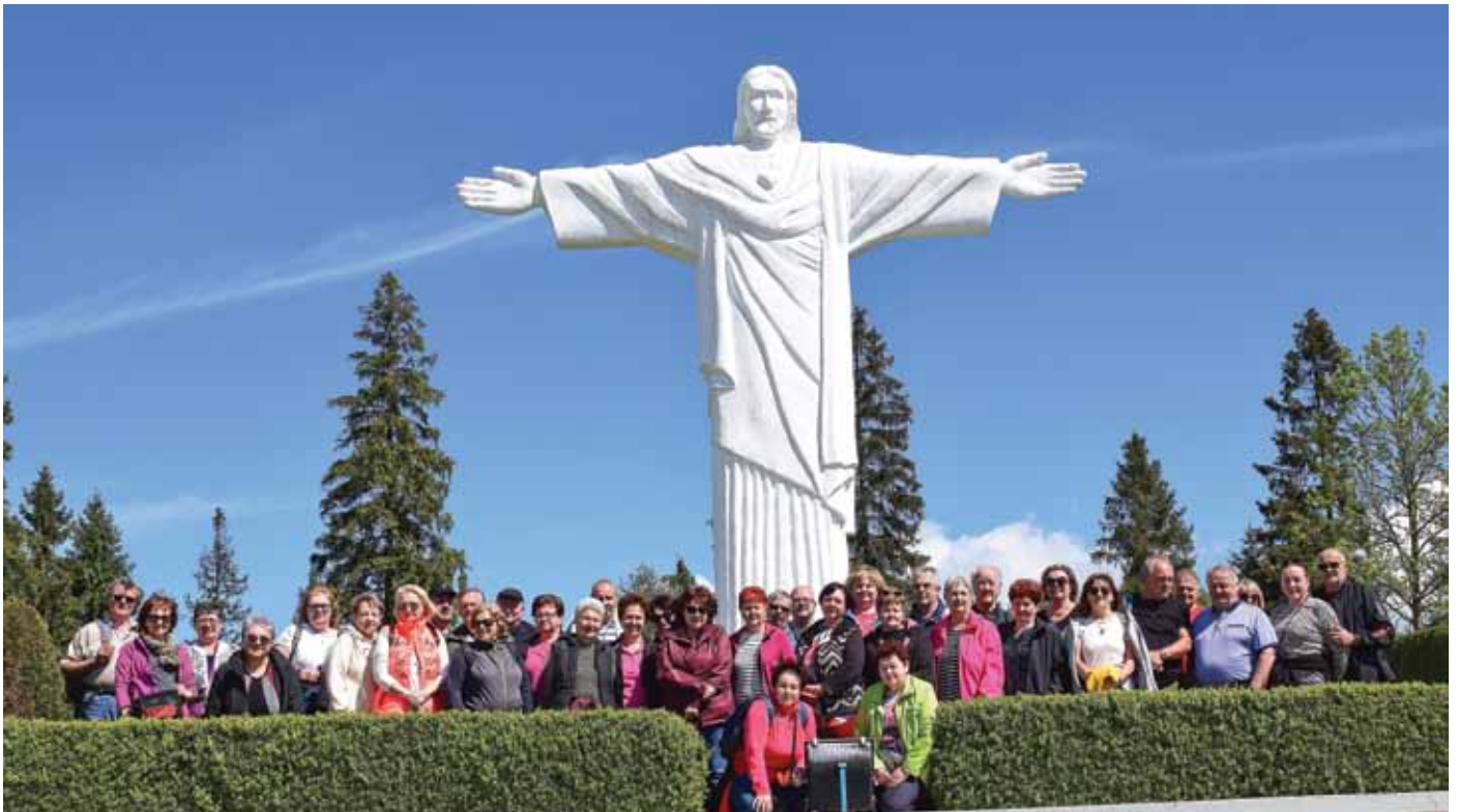
Z činnosti Základnej organizácie Jednoty dôchodcov na Slovensku viac na str. 14 - 15