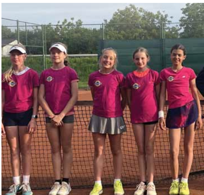
Na fotke družstvo mladších žiačok TK ŠK Blava 1928 Jaslovské Bohunice