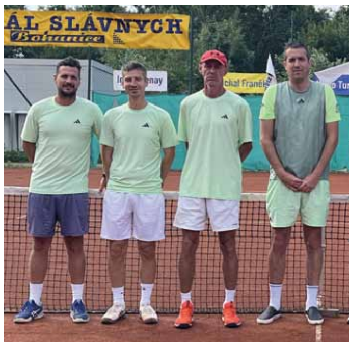
Na fotke družstvo seniorov 35+ TK ŠK Blava 1928 Jaslovské Bohunice, foto: Jana Holovičová