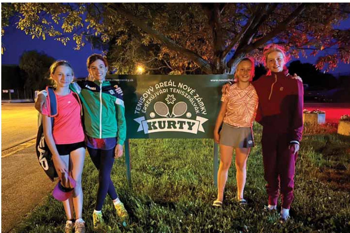
Na fotke družstvo mladších žiačok TK ŠK Blava 1928 Jaslovské Bohunice