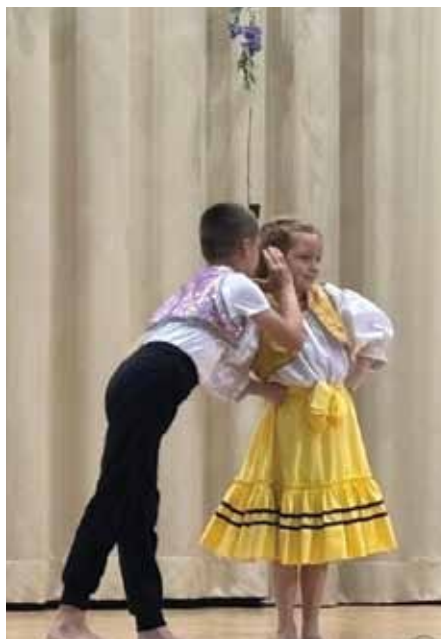
Deň matiek viac na str. 18