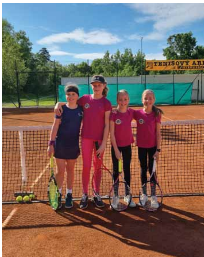
Na fotke družstvo dievčat do 10 rokov TK ŠK Blava 1928 Jaslovské Bohunice