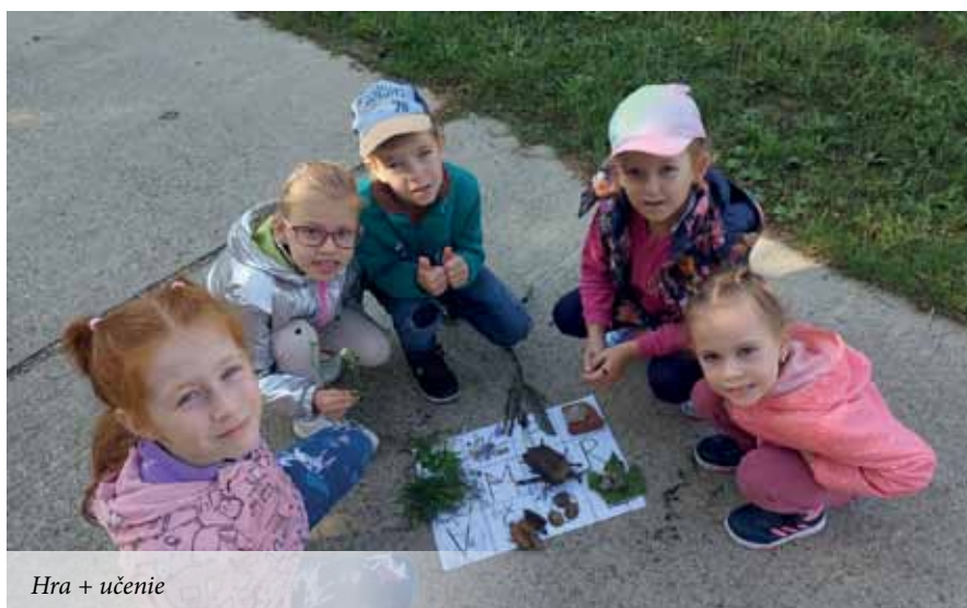
Hra + učenie