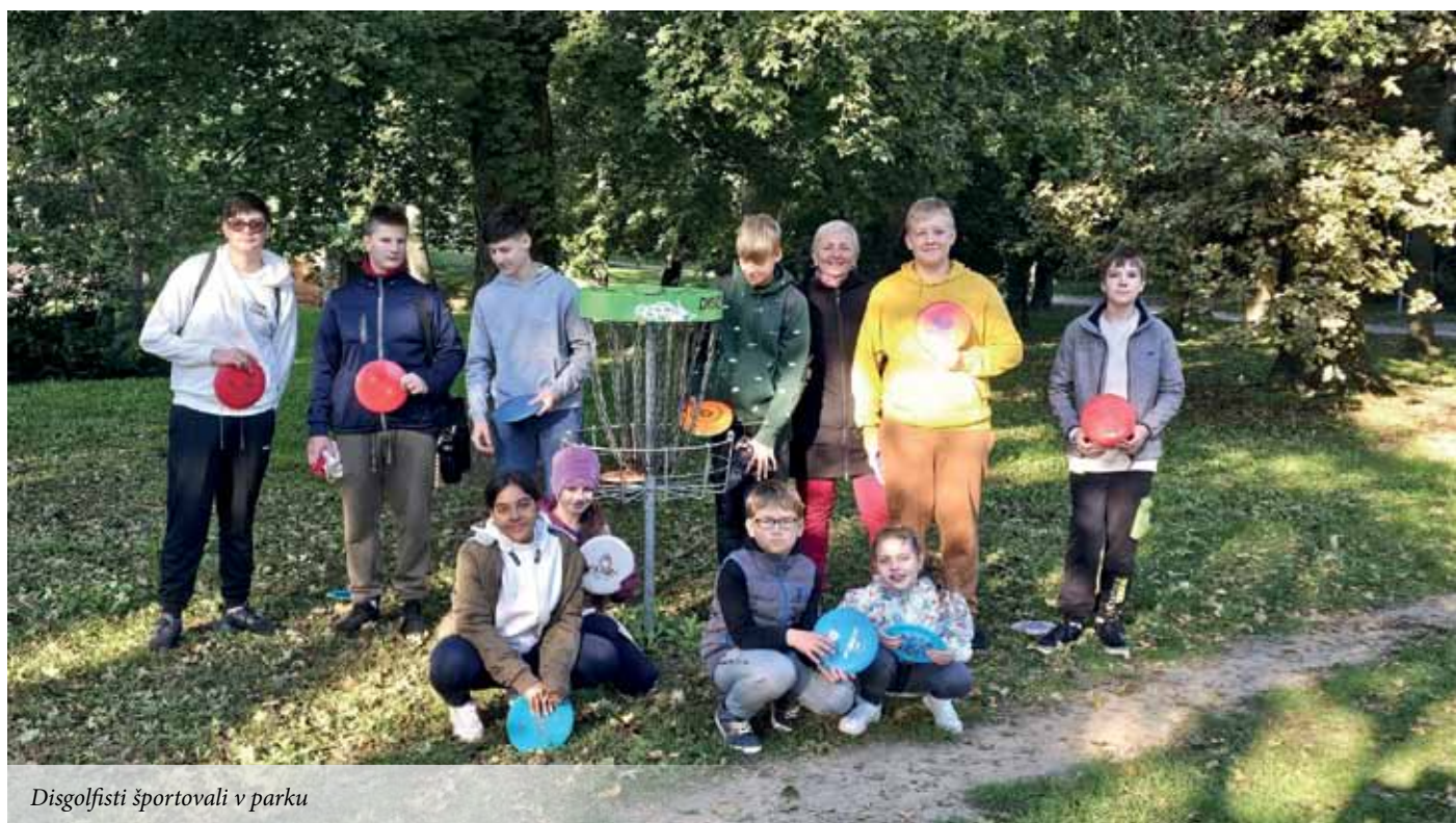
Disgolfisti športovali v parku