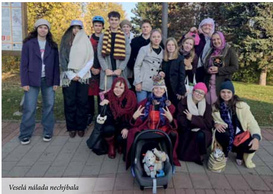
Veselá nálada nechýbala