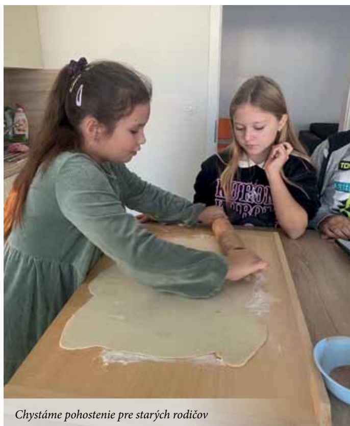
Chystáme pohostenie pre starých rodičov