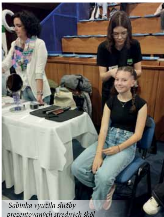
Sabinka využila služby prezentovaných stredných škôl