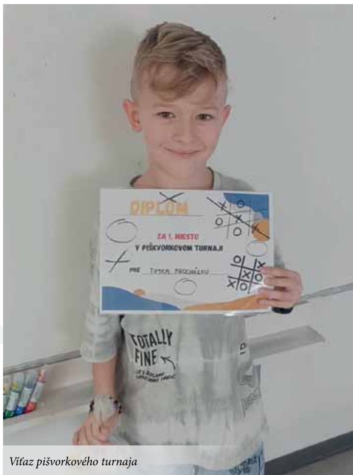
Vítaz piškovkového turnaja