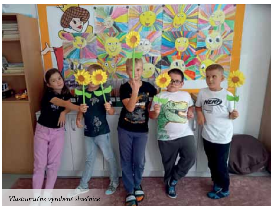
Vlastnoručne vyrobené slnečnice