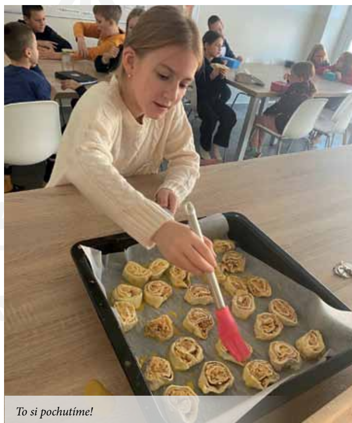
To si pochutíme!