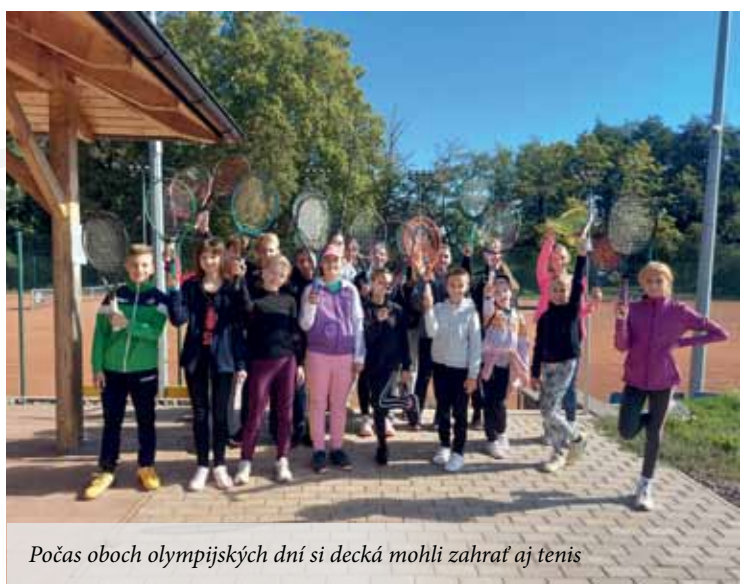
Počas oboch olympijských dní si decká mohli zahrať aj tenis