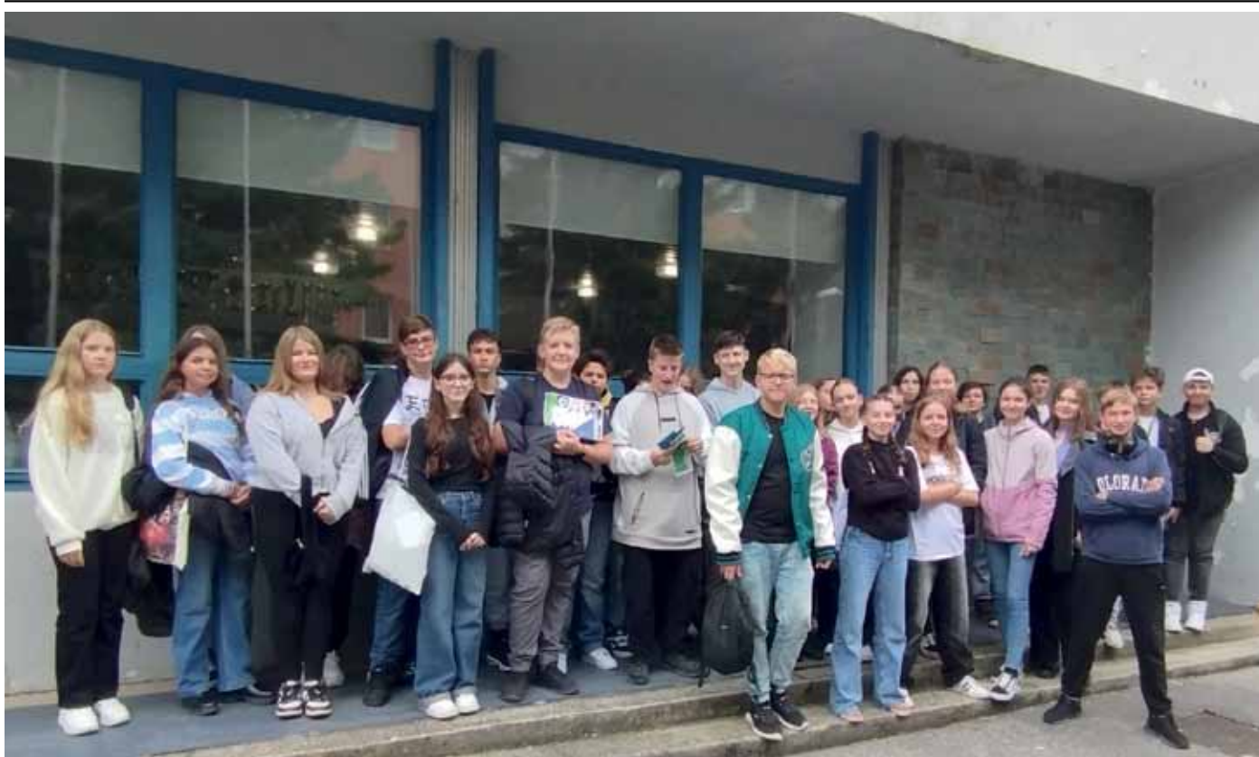
Rozhodnúť sa pre dobrú školu nie je jednoduché, pomôcť môže prezentácia stredných škôl