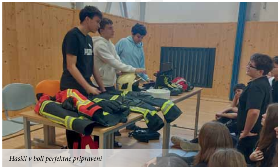
Hasiči v boli perfektne pripravení