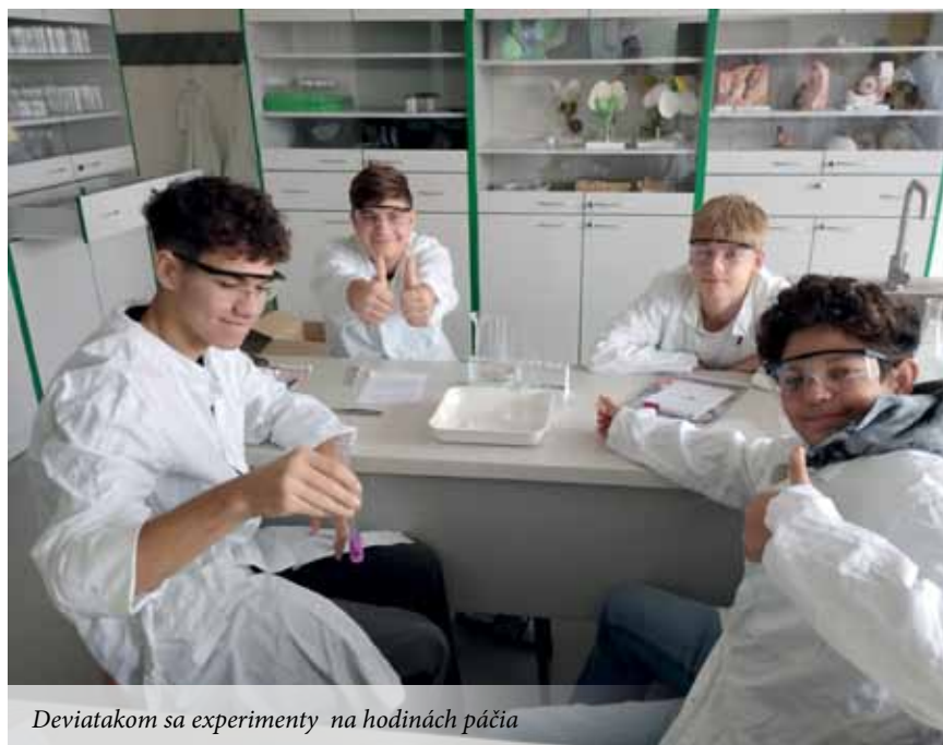
Deviatakom sa experimenty na hodinách páčia