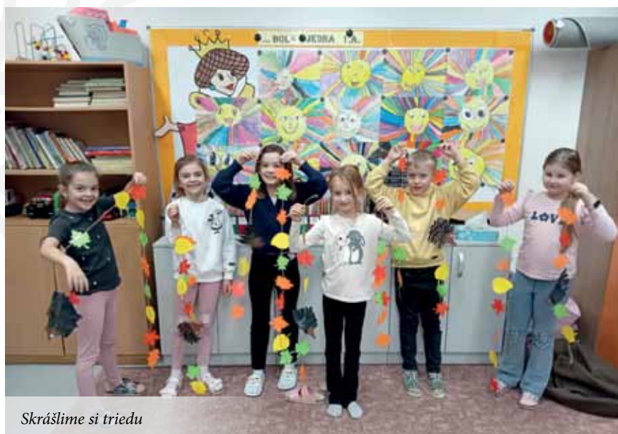
Skráślime si triedu