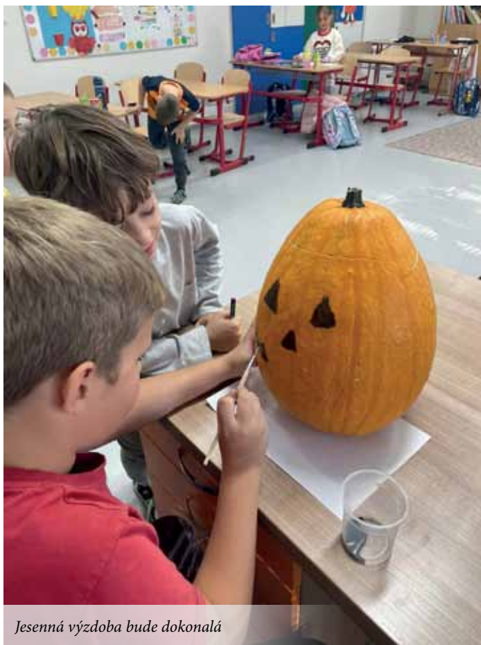
Jesenná výzdoba bude dokonalá