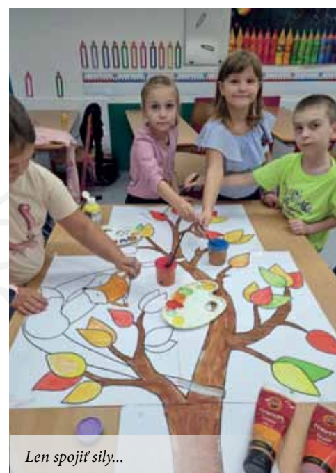
Len spojif sily...