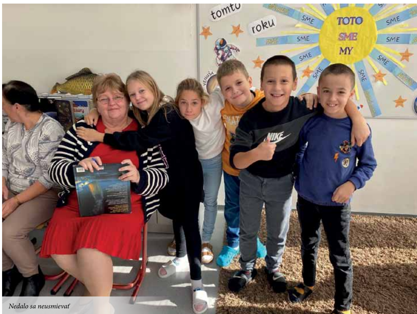
Nedalo sa neusmievať