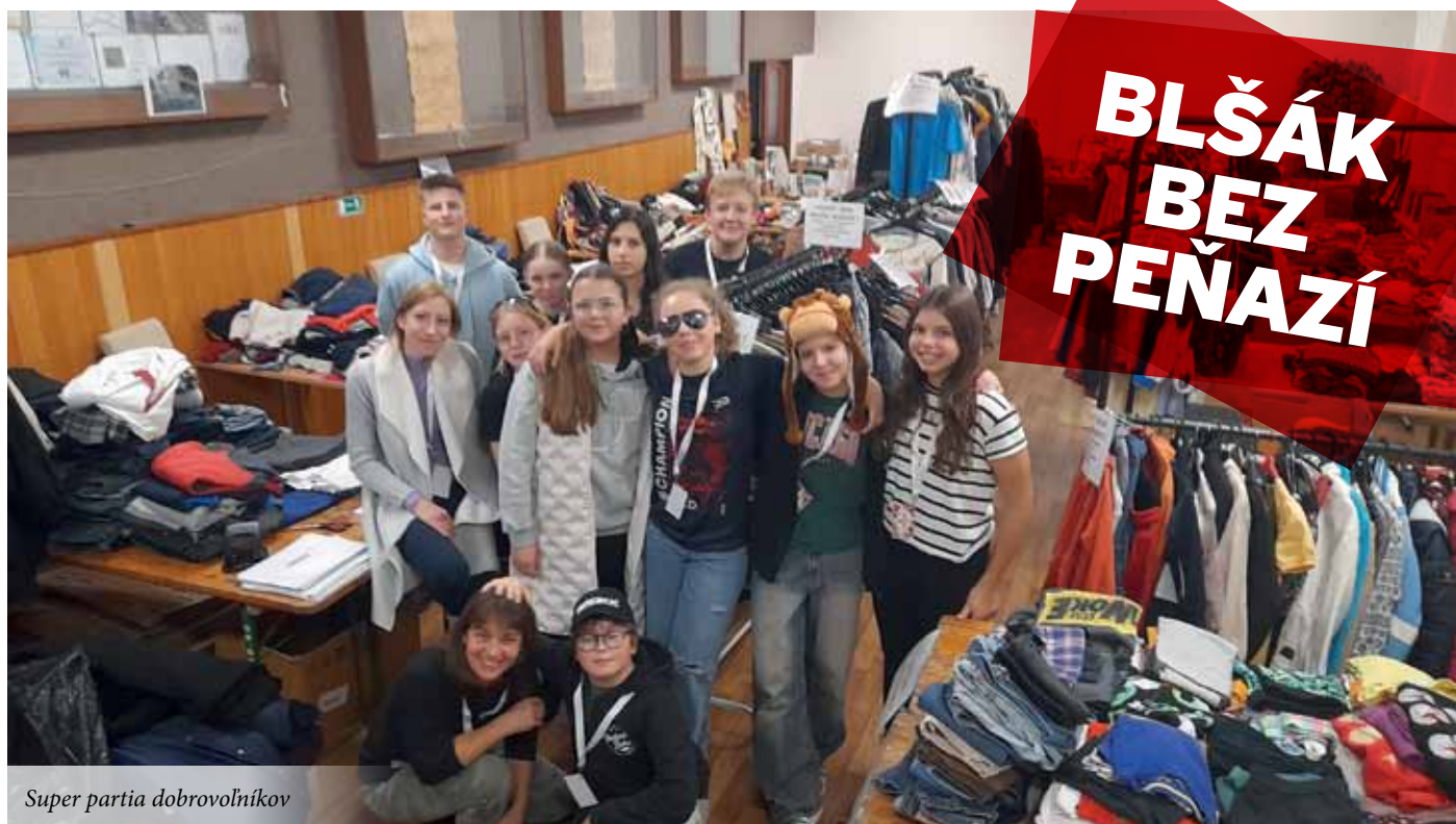
Super partia dobrovoľníkov

Každý z nás má doma veci, ktoré nepotrebuje. Prekladáme ich z miesta na miesto alebo ich držíme v skrini, lebo je nám ľúto vyhodit' ich. Mysliac si, že do sukne schudneme alebo že nám blúzka bude o pár dní lepšie sedieť, sa v nás len prehľbuje pocit, že si nemáme čo obliecť. Pozná to snáď každá žena.