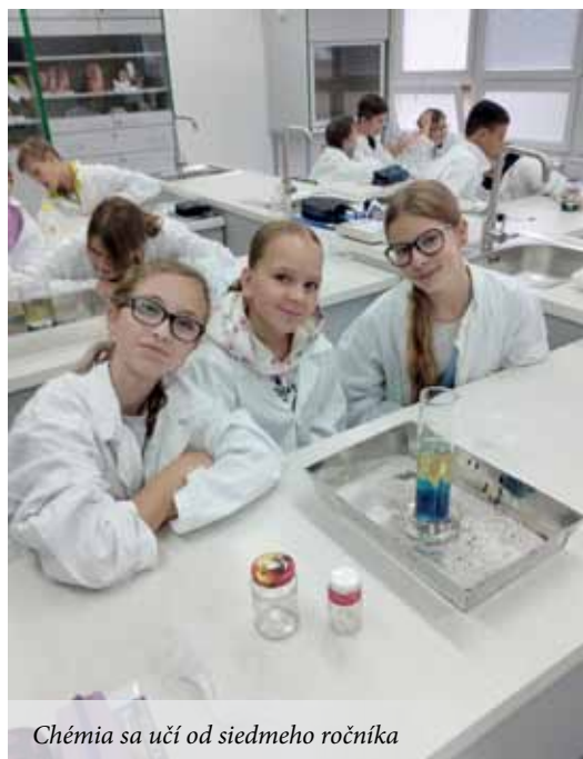
Chémia sa učí od siedmeho ročníka