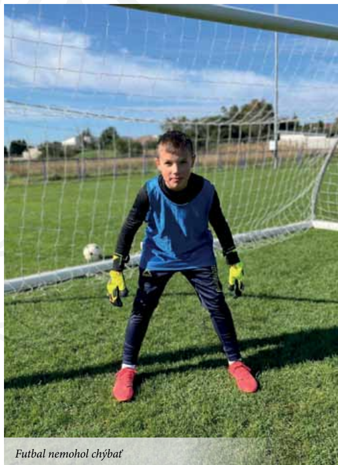
Futbal nemohol chýbať