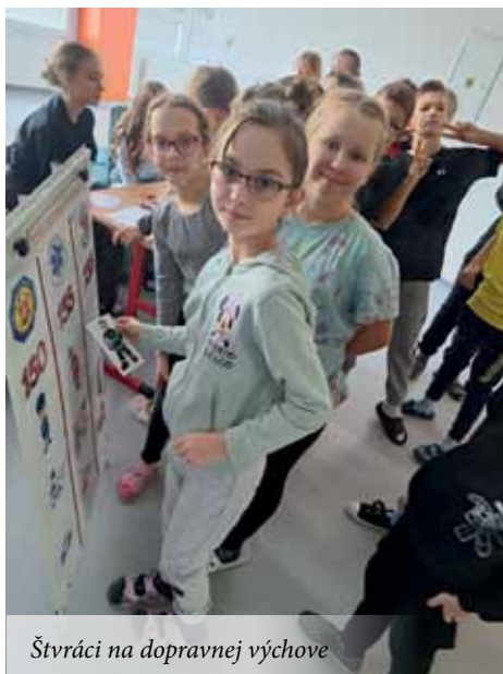
Štvráci na dopravnej výchove