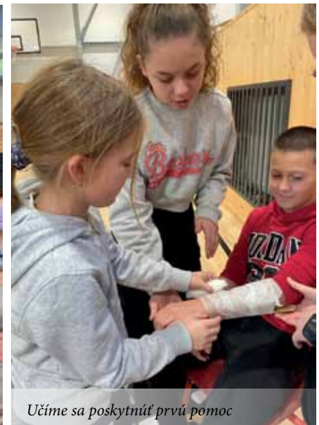
Učíme sa poskytnúť prvú pomoc