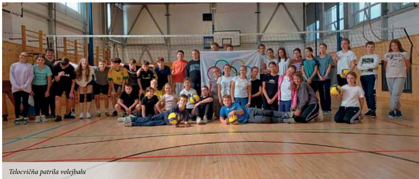
Telocvična patrila volejbalu