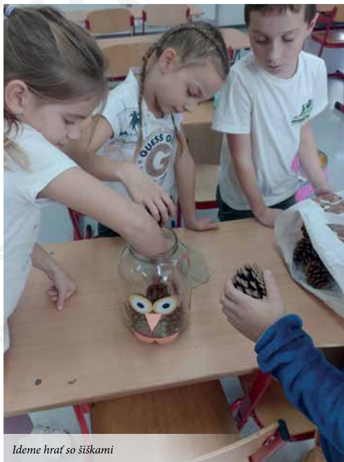
Ideme hrať so šiškami