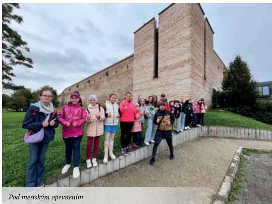
Pod mestským opevnením