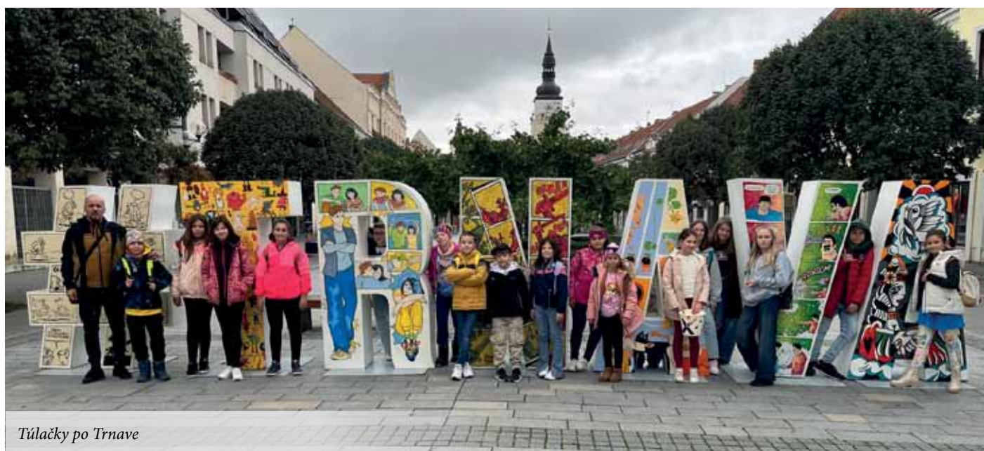
Túlačky po Trnave