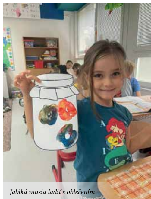
Jablká musia ladiť s oblečením