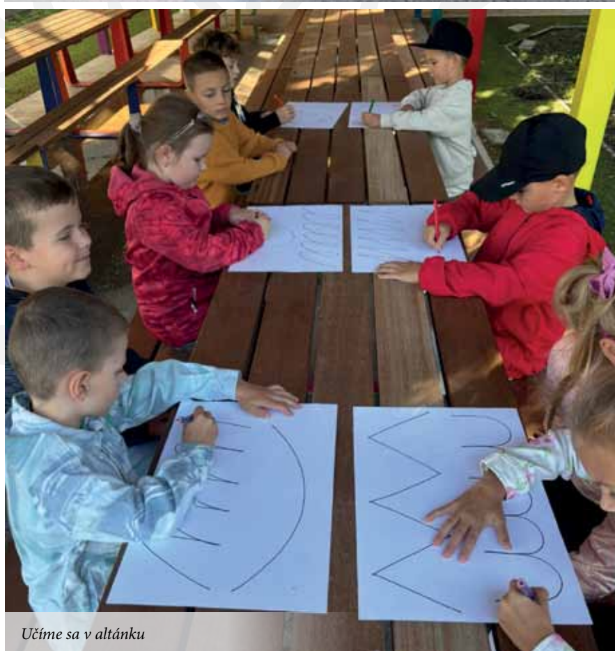
Učíme sa v altánku