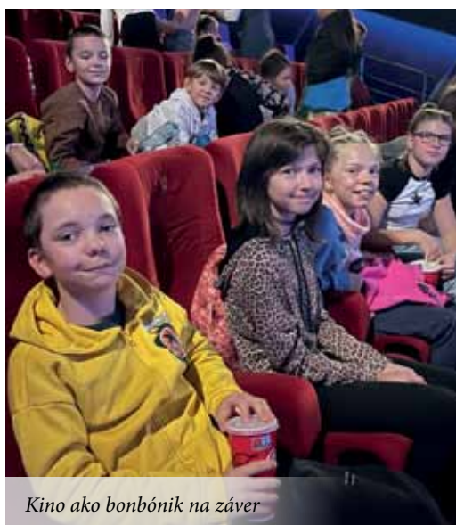
Kino ako bonbónik na záver