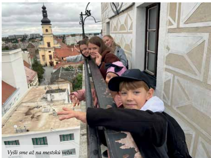
Vyšli sme až na mestskú vežu