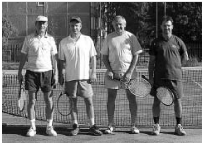
● Spomienka na leto - chlapci túžiaci po dobrom tenise...

Konečne prišiel čas doplniť tekutiny po štyroch hodinách strávených na kurte a odovzdať víťazovi putovnú trofej. O tom, že trofej bude putovná sme vlastne rozhodli, až keď sme s ubolenými nohami sedeli pri dobrom pive a začalo nám byť smutno, že sa turnaj skončil. Sľúbili sme zopakovať si túto príjemnú zábavu a ak nám zdravie dovolí, organizovať takýto turnaj pravidelne, s tým, že sa po-