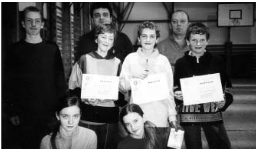
● Reprezentanti Základnej školy Jaslovské Bohunice na X. ročníku streleckej súťaže O putovný pohár starostu obce Jaslovské Bohunice.