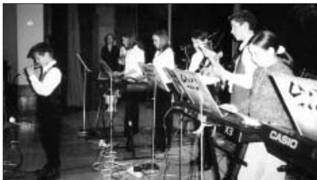
• Skupina Crazy Team na tohtoročnom Rodičovskom plese.

Na koncerte sa zúčastnili zástupcovia vedenia ZUŠ Hlohovec, ZŠ Jaslovské Bohunice, pozvaní boli zástupcovia obce, rodičia a rodinní príslušníci žiakov. Redakcia