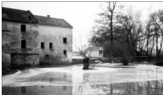
● Aby voda vrazila do Pavlovičovho mlyna, chýbali centimetre. Jej preniknutiu zabránil oporný múr.

búrky odskúšajú pripravenosť našich potokov, najmä Blavy. A to je z roka na rok horšie. Štát neposkytuje dost' peňazí správcovi toku Povediu Váhu na údržbu. Potom to vyzerá ako v hororovom filme. Prestarnuté stromy padajú do potokov, mohutné kmene zужujú prietokový profil a problém narastá. Opakovane za účasti pracovníkov životného prostredia sme