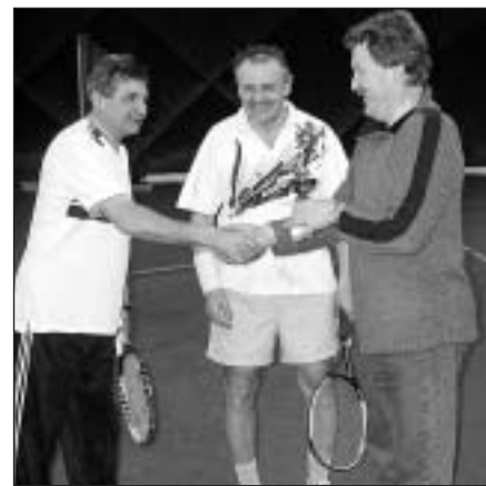
● Novomestská trofej pre víťaza.