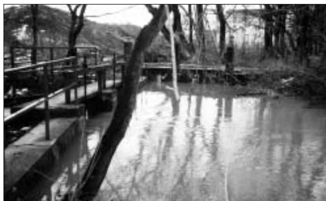
● Stav mostu si žiada rozsiahle opravy a veľké investície. Väčšia voda ich môže neopraviteľne poškodiť. Bohunický spúšť bol riadne rozbesnený.