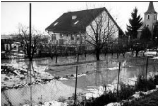
● Voda riadne vystrašila majiteľa pekného nového rodinného domu. Blava sa vyliala do záhrady. Do suterénu domu sa dostala z radošovskej zatopenej kanalizačnej šachty na lúkach. Nič príjemné. Našťastie otepľovanie pokračovalo a voda začala vsakovať.