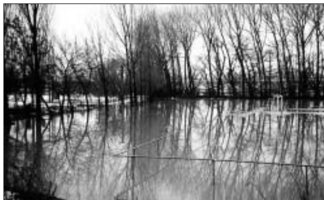
● V Radošovciach takto vyzeralo futbalové ihrisko, na ktorom sa bez väčších problémov dalo hrať vodné pólo...