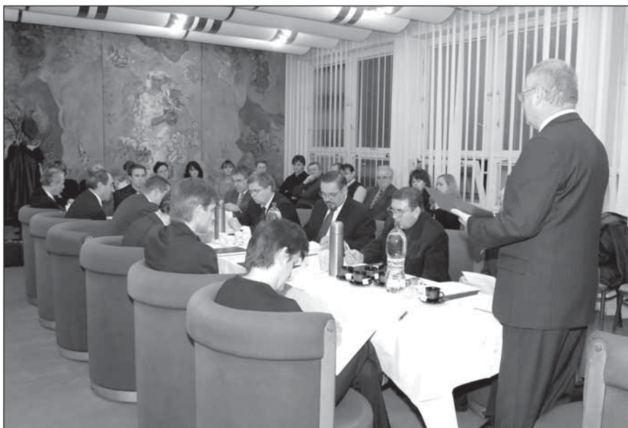
● Novozvolení poslanci na svojom prvom zasadnutí 19.12.2006.

Rozhodnutím predsedu NR SR č. 63/2006 Z. z. o vyhlásení volieb do orgánov samosprávy obcí uverejnených v Zbierke zákonov č. 28/2006 boli vyhlásené voľby do obecných (mestských) zastupiteľstiev a voľby starostov (primátorov) obcí, ktoré sa uskutočnili 2. decembra 2006. Voľby trvali jeden deň a volebné miestnosti boli otvorené od 7.00 hod. do 20.00 hod.