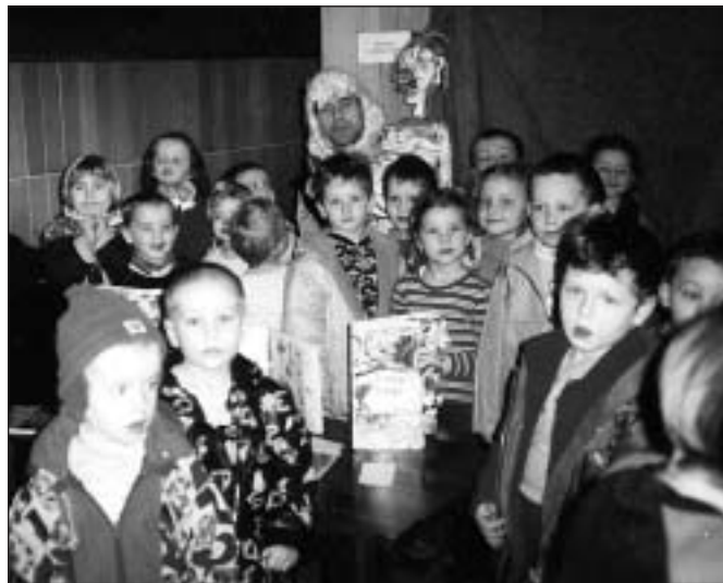
● Zvedavými otázkami a spontánnou radosťou z bábok najmenší škôlkari ničím nezaostali za svojimi staršími spolužiakmi.

so sebou i Fifi dieľko. Deti živo komunikovali s bábkami a prežívali hrané príbehy.