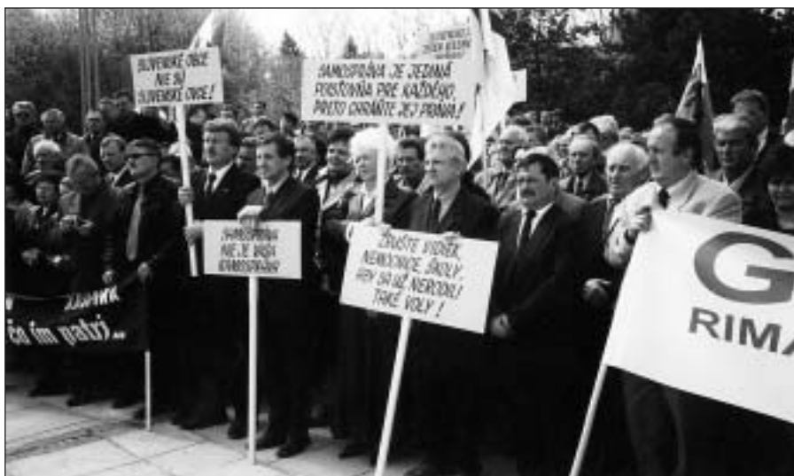
● Starostovia a primátori zo Združenia miest a obcí regiónu JE Jaslovské Bohunice protestujú na Námestí slobody v Bratislave za práva svojich obcí, miest a občanov.