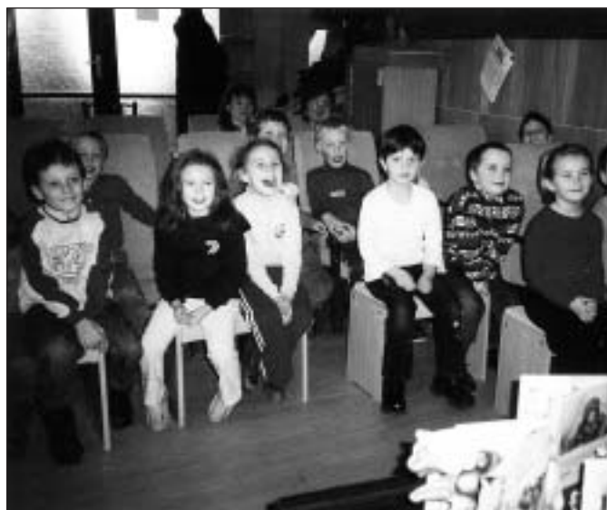
● V prvý deň navštívili knižnicu škôlkari predškolského veku.

sa nadýchať čerstvého jarného vzduchu prihriateho slnečnými lúčmi. Odchádzali so sľubom, že sa ešte vrátia i v sprievode svojich rodičov. Verím, že prídu, nakoľko kniha je a zostane najdostupnejším prostriedkom k získaniu vedomostí. L. Sersenová