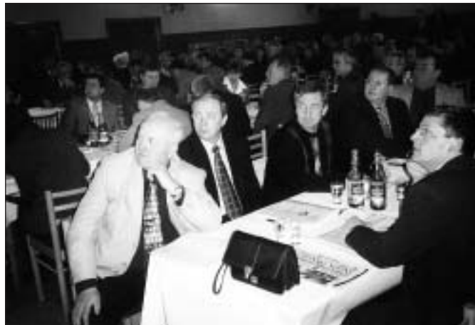
● Pohľadom na rokujúcich starostov sa vraciame k Snemu ZMO - región JE Jaslovské Bohunice, ktorý sa konal 4. marca 2004.