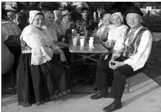
● Ťažké i veselé stávanie mája s vystúpeniami dychovej hudby Dubovanka i folklórneho súboru Blavanka.