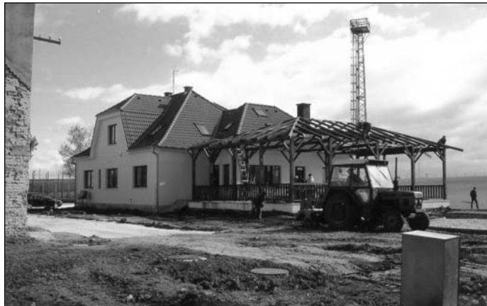
● Takto dnes vyzerá obnovená vilka s ubytovaním, barom a prístavenou veľkou terasou.

investovať. Bolo veľmi smutné vidieť ako naši menšinoví spoluobčania ničili všetko, čo priťahovalo ako magnet. A nielen oni. Vtedy sme podnikli vznik „ORESU“, ktorý areál nakoniec kúpil. Zo začiatku na „oštaru“,