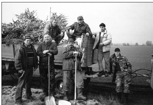
● Brigády na výsadbe nových alejí, kŕmení, napájani počas sucha, vytváraní umelých krytov zveri sú samozrejmosťou. Vďaka poľovníkom, príroda je ako-tak pestrá. Prvý je chov, až potom lov.