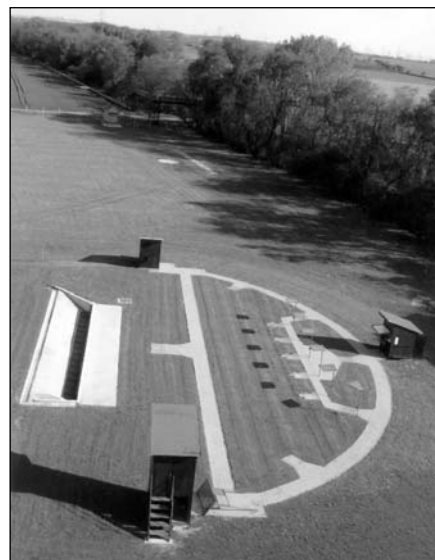
● Pohľad na strelnicu z najvyššej veže. Tu budú 23. júna tréningy a 24. júna prvá súťaž v trape O samosprávny pohár. V pozadí je golfová „odpaľovačka“.