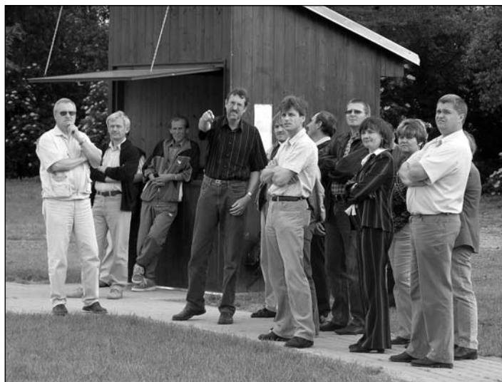
• V júni si členovia obecného zastupiteľstva prezreli i strelnicu.