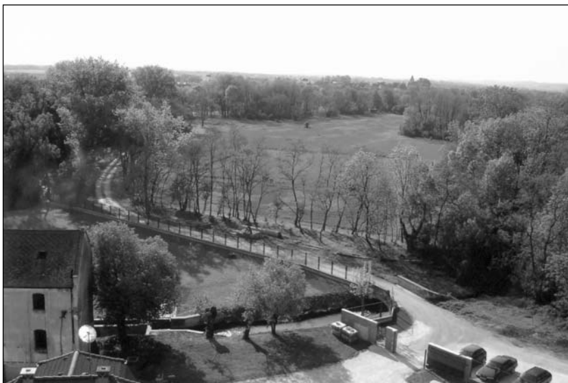
● Zeleň okolo Blavy a mlynskeho náhonu patrí medzi vzácnosti a pôvodný vzhľad územia. Lúka sa používa na kónský parkúr a ďalšie aktivity.