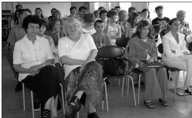
● Na koncerte základnej školy umenia.