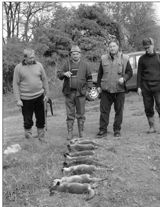
● Po hone na líšky boli unavení nielen lovci, ale aj fotoaparát.