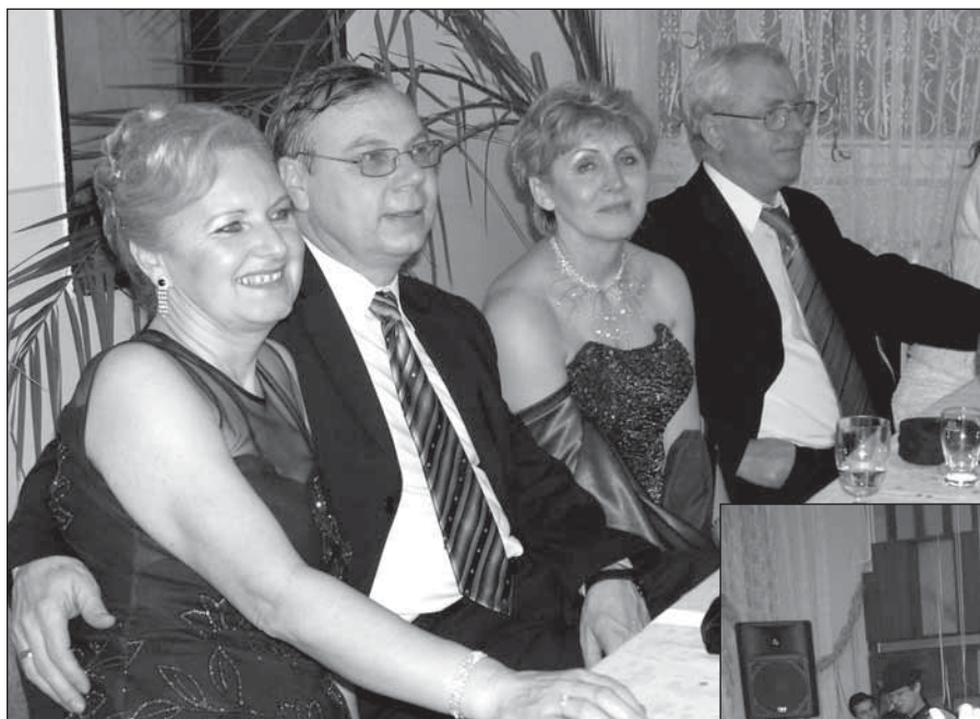
● Kolektív Obvodného zdravotného strediska Dechtice sa super bavil.

S fašiangovým obdobím je spojená tradícia plesov. Našu obec v tomto období navštevujú osobnosti z radov politikov, funkcionárov, podnikateľov i starostov. Výnimkou nebol ani 10. február 2006, kedy sa konal v Spoločenskom dome Jaslovské Bohunice už XV. Reprezentačný richtársky ples, ktorý poriadalo ZMO, región JE Jaslovské Bohunice. Ples už tradične otvoril predseda regionálneho ZMO, domáci starosta.