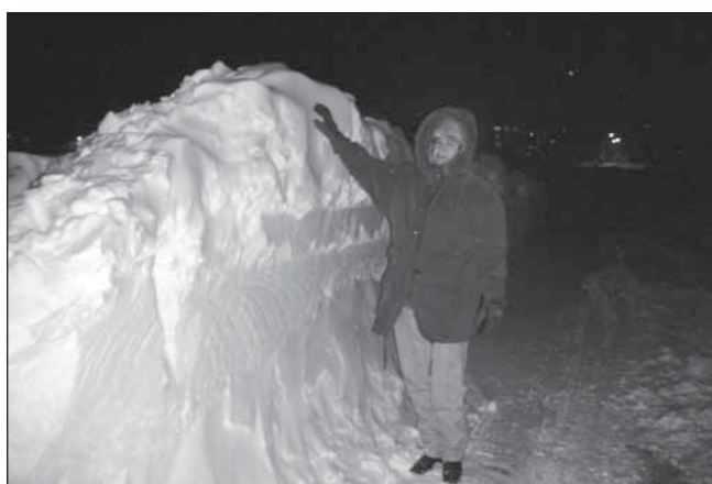
● Závej na hlavnej ceste smerom do Špačniec

lefonátoch sa potvrdilo, že na ceste smerom do Trnavy sa stalo viacero dopravných nehôd. Do 18.00 hodiny bolo isté, že cesta je neprejazdná. Vybrala som sa teda s fotoaparátom, aby som zachytila situáciu na hlavnej ceste v smere Špačince – Trnava. Bola už tma, preto sa mi podarilo iba niekoľkými zábermi zachytiť dvojmetrové záveje, pri odstraňovaní ktorých zlyhala aj fréza.