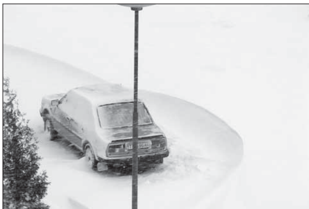
● Ten, kto zaparkoval auto na krajnici cesty, zistil, že sa nemusí nikde ponáhľať.

Do kancelárie Obecného úradu v Jaslovských Bohuniciach sa prišli sťažovať občania, že sa nemôžu dostať do krajského mesta, nakoľko nejú autobusy. Po viacerých te-