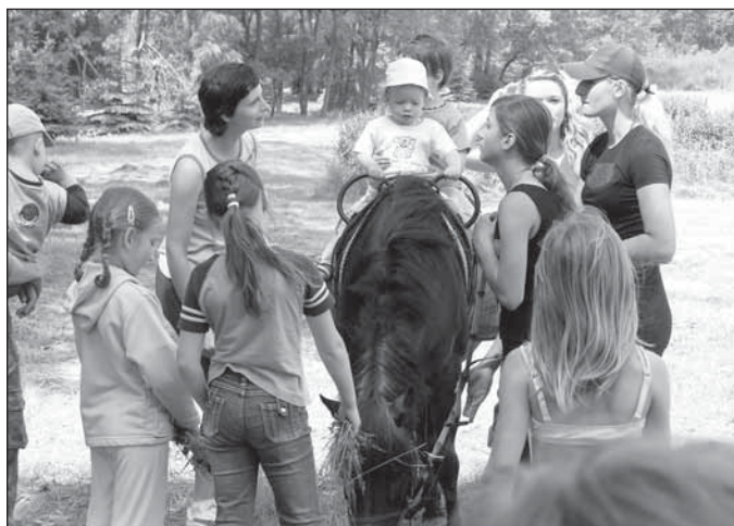
• Program pre deti pripravil aj Jazdecký klub AXA.