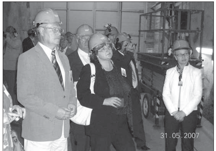
● Podzemné úložisko jadrového odpadu v JE Loviisa.

hotela Rantasipi Aulanko, o sto kilometrov vzdialenej Hämeenline. Diaľnica, žiadne osady, dediny, iba jazerá a krásne lesy a prírodné rezervácie. Tu zaujala starostlivosť o historické pamiatky, vojenské hradby, kasárne, starú vojenskú techniku. Okolo jazera Vanajavesi turistický pieskový chodník, po celej dĺžke osvetlený, sem tam lavička,