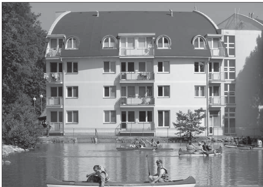
• Na rybníku boli pre deti pripravené člny, v ktorých sa mohli povozit'.

Aj jaslovskobohunické deti v piatok 1. júna oslavovali. Obec organizovala oslavy Dňa detí v spolupráci so základnou školou a materskou školou. V škole sa neučilo. Pre všetky deti bol pripravený program, na ktorom sa okrem iných podieľali Policajný zbor SR v Jaslovských Bohuniciach, Dobrovoľný hasičský zbor Jaslovské Bohunice, Jazdecký klub Axa, PZ Hlohovec.