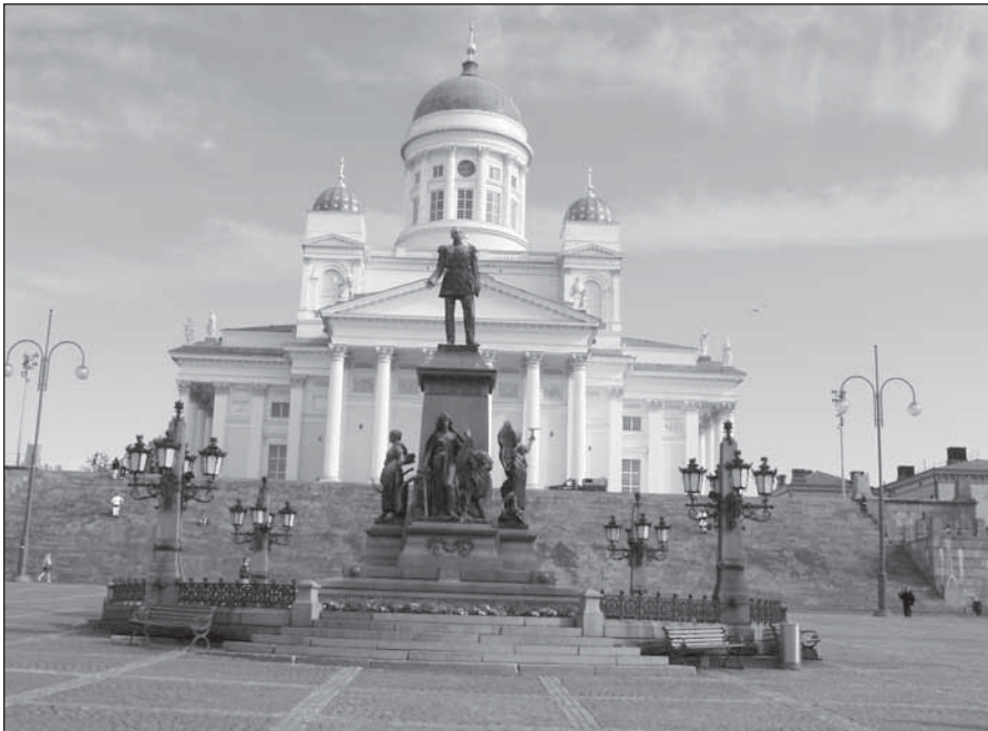
● Námestie v Helsinkách.

Fínska ústava a jej miesto v súdnom systéme sú neobvyklé, pretože neexistuje žiadny ústavný súd a najvyšší súd nemá výslovné právo prehlásiť nejaký zákon za neústavný. Ústavnosť zákonov sa vo Fínsku v zásade overuje hlasovaním v parlamente. Jedine ústavná komisia posudzuje nejasné zákony