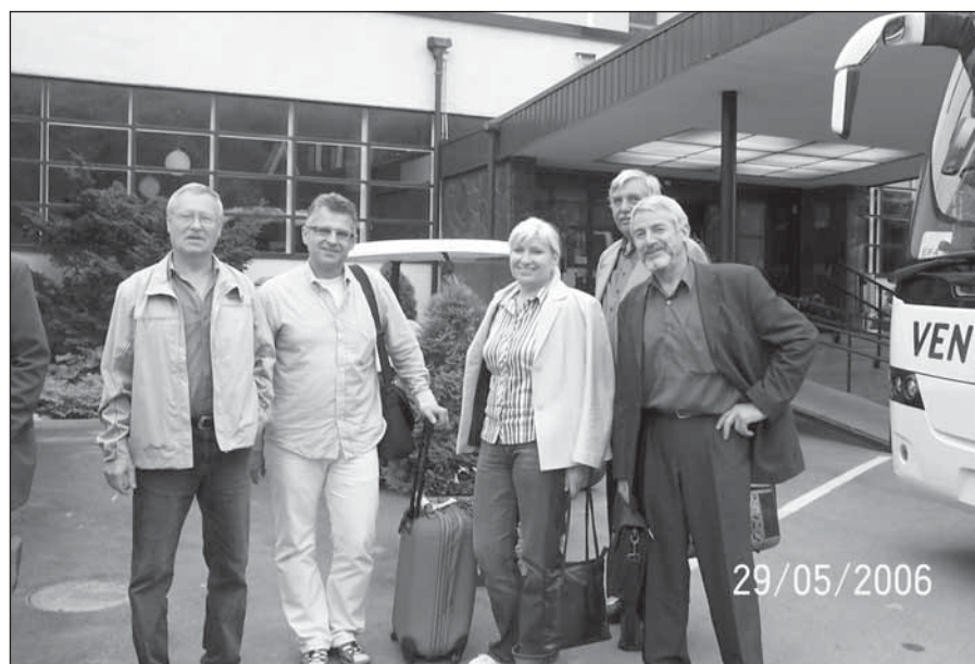
● Pred hotelom Rantasipi Aulanko v Hämeenline.

Ekonomický rast Fínska sa v posledných rokoch pohybuje v percentách. Rýchlo sa zväčšujúca integrácia so západnou Európou - Fínsko bolo jednou z 12 krajín, ktoré v roku 1999 prijali euro - bude v nasledujúcich rokoch dominovať fínskej ekonomike.