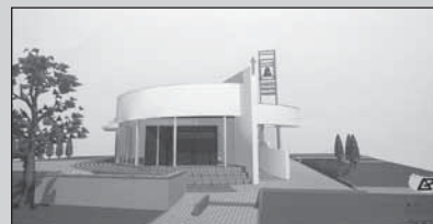
● A takto bude vyzerat' nový dom smútku.

Obecný úrad Jaslovské Bohunice vyzýva občanov, ktorí ešte neuzatvorili nájomnú zmluvu na hrobové miesto, aby si túto povinnosť v priebehu roka 2007 splnili a nájomnú zmluvu uzatvorili. Výzva sa týka nájomcov všetkých hrobov na cintorínoch v Jaslovciach a v Paderovciach. - ocú -