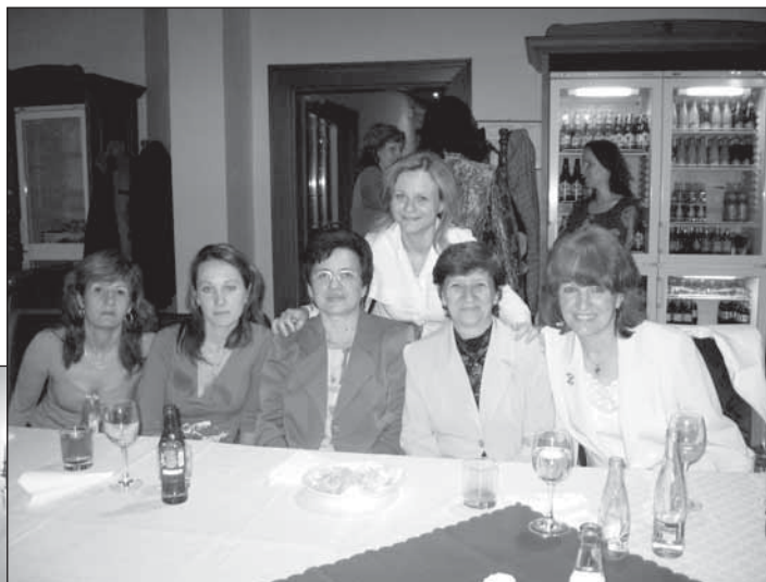
● Usmiate učiteľky si s pôžitkom vychutnávali svoj sviatok.

poludnie spojené s kultúrnym programom a sviatočným posedením v Regionálnom konzultačnom centre v Jaslovských Bohuniciach. V zrkadlovej sieni základnej školy sa učители zúčastnili na kultúrnom programe a v nádherných priestoroch kaštieľa sa uskutočnilo slávnostné posedenie s občerstvením, na ktorom prítomným poďakovali za ich prácu starosta obce a zástupcovia rodičov. V príhovoroch zdôraznili, že práca učiteľa nie je len zamestnanie, ale predovšetkým poslanie, ktoré, ak je vykonávané s láskou a na vysokej odbornej úrovni, sa odzrkadlí na výsledkoch žiakov. Popriali im pevné zdravie a veľa úspechov v ich zodpovednej práci.