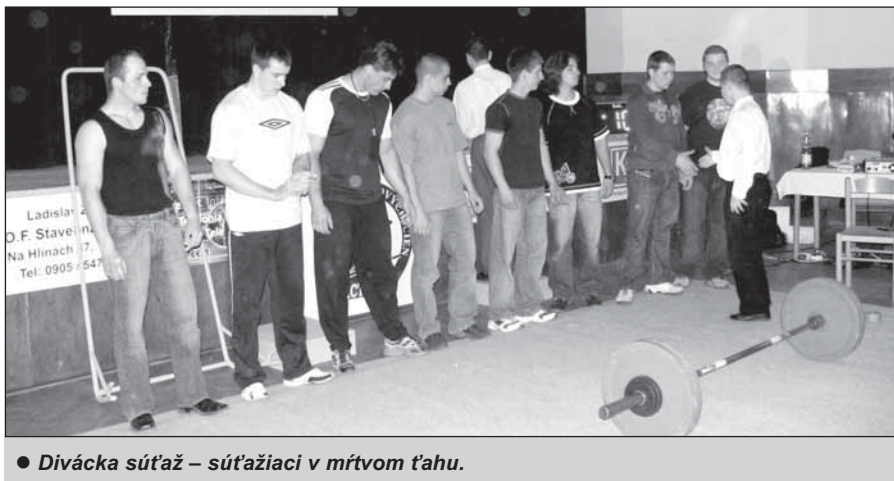
● Divácka súťaž – súťažiaci v mŕtvom ťahu.