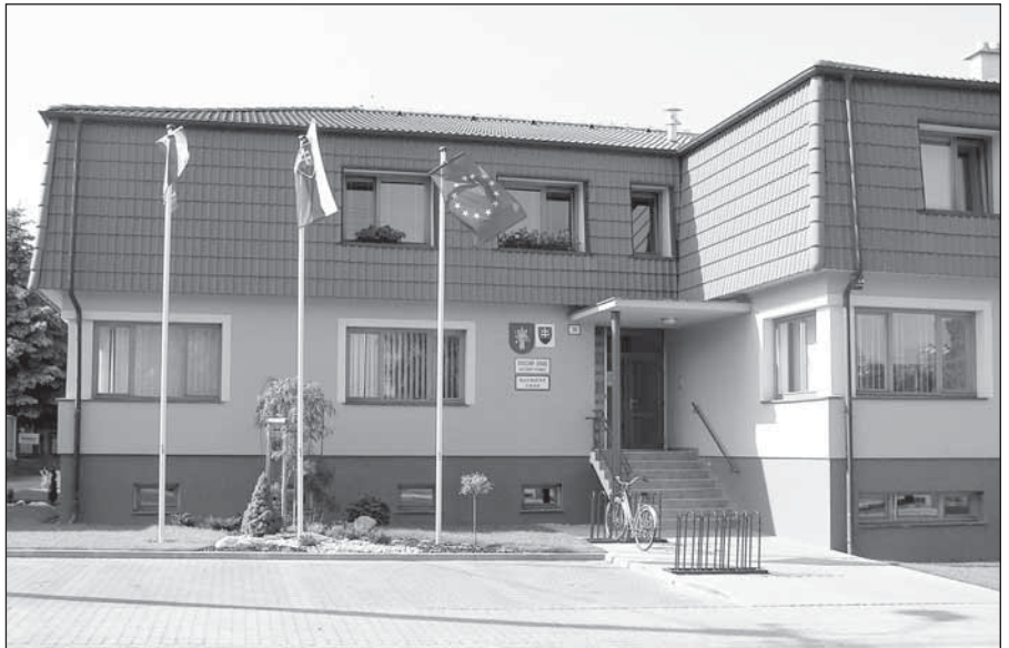
● Moderný obecný úrad nám môžu mnohí závidieť.

Preťahovali sme sa 14. mája tohto roku. Nové interiérové vybavenie, moderná výpočtová technika, novotou a čistotou voňajúce sociálne zariadenia a hlavne dostatok priestoru pre každého zamestnanca, vytvárajú podmienky pre lepšiu hygienu a kvalitu práce, ale i pre lepšiu orientáciu a poskytovanie služieb občanom.