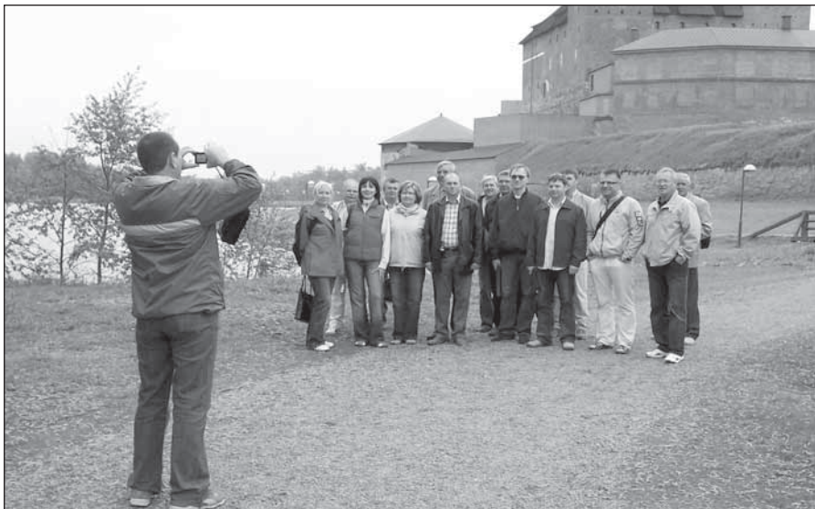
● Starostovia na prechádzke okolo jazera Vanajavesi.

a odporúča zmeny, ak je to nevyhnutné. V praxi ústavná komisia plní povinnosti ústavného súdu. Fínskou špecialitou je možnosť prijímať v obyčajných zákonoch výnimky z ústavy, ktoré sú prijaté rovnakým postupom ako ústavné dodatky. Napríklad zákon o stave pohotovosti, ktorý dáva štátnej rade výnimočné práva v prípade národného ohrozenia. Pretože tieto práva hrubo porušujú základné ústavné práva, zákon bol prijatý rovnakým spôsobom ako ústavný dodatok. Aj keď môže byť zrušený rovnakým spôsobom ako bežný zákon.