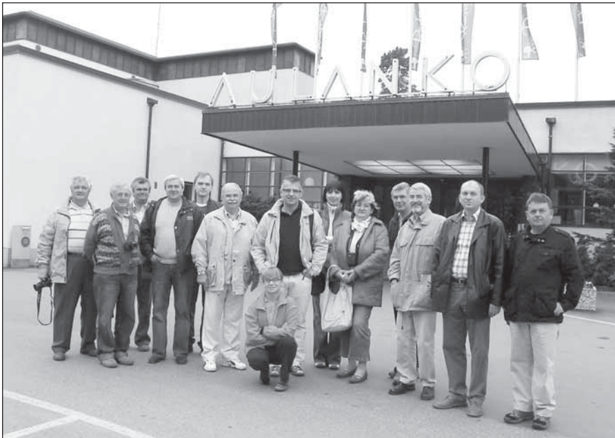
● Časť výpravy starostov a primátorov pred hotelom Aulanko v Hämeenline.