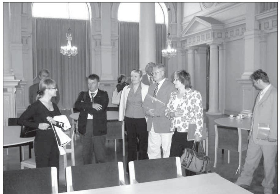
● Fotografia z prijatia na Radnici v Helsinkách.

Podľa fínskej Ústavy je najvyššou legislatívnou autoritou jednokomorový parlament (po